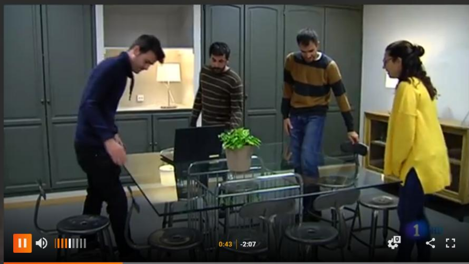
0:43 | -2:07